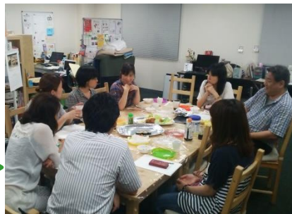
▲ CoCo サロン北九州 Link 福祉施設での話し合いの風景

自主的で身近な学習、交流、情報交換の場づくりを JVCA は応援しています。地域ごと、分野ごと、呼びかける範囲やテーマは自由。研修で役員が全国へおじやました際の交流会も好評です。