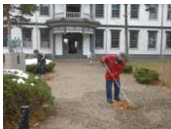
▲就労体験(安積歴史博物館)