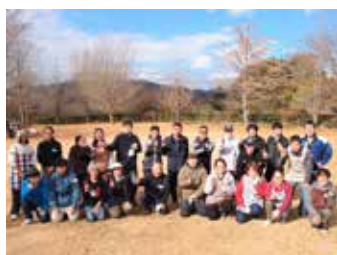
▲バーベキュー交流会