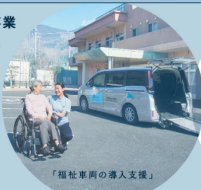
「福祉車両の導入支援」