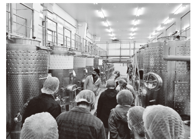
ふくしま逢瀬ワイナリーの見学