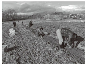
農作業体験(ニンジン収穫)