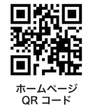
ホームページ QRコード

説明会の日程と会場は、スモスタ！ホームページでご案内いたします。 (「新しい生活様式」に対応するため、参加人数を制限させていただく場合があります)