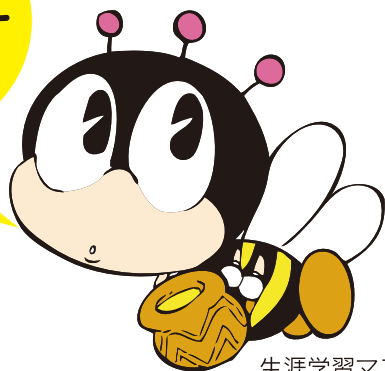
生涯学習マスコット マナビイ