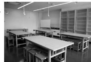
工作室(勤労青少年ホーム)