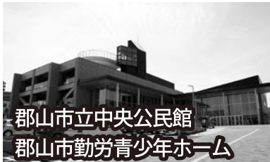
郡山市立中央公民館 郡山市勤労青少年ホーム