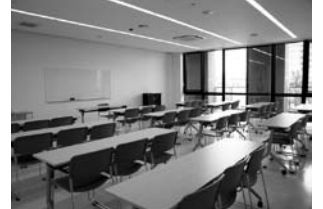
講義室(中央公民館)