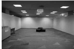
市民プラザギャラリー

休館日：毎週月曜日 / 年末年始 10:00 ~ 19:00 まで (市民交流プラザ7Fは21:00まで) 駐車場：有(有料)