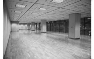
市民ふれあいプラザ(展示室)