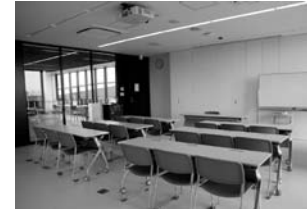
講義室(中央公民館)