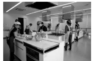
調理室(勤労青少年ホーム)