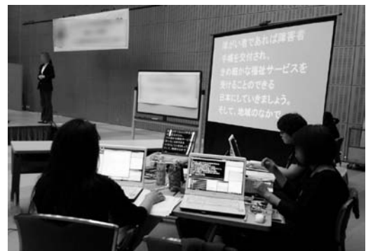
活動風景 パソコン要約筆記 チーム派遣