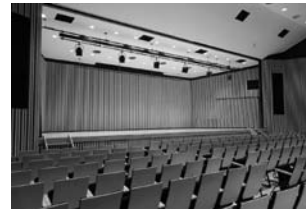
多目的ホール(勤労青少年ホーム)