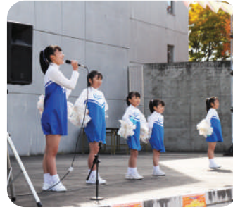
郡山チアリーダーズ