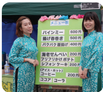
在福島県ベトナム人協会

秋晴れの中、フェスタ参加団体の皆さんは、各々飲食・販売、ワークショップ、活動紹介ブースで来場者と触れ合い、他の団体の皆さんと交流する姿が印象的でした♪