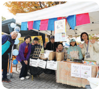
ケアサポート福島