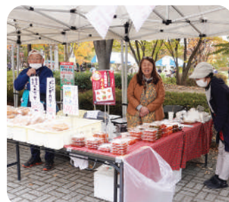
NPO法人 韓日文化交流を計る会