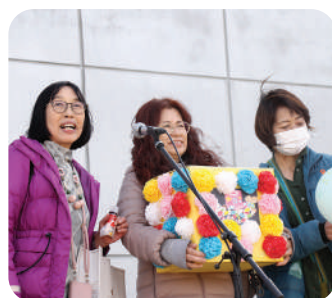
国際交流の会 かるみあ