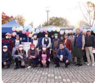
認定NPO法人 キャリア・デザイナーズ