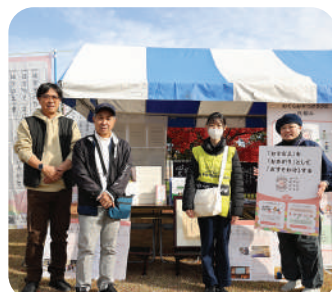
認定NPO法人 おてらおやつクラブ