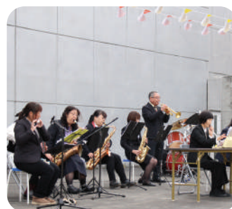
カンタービレふくしま