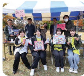
郡山ボードゲームクラブ