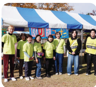
総合南東北病院ボランティア 紙ふうせん