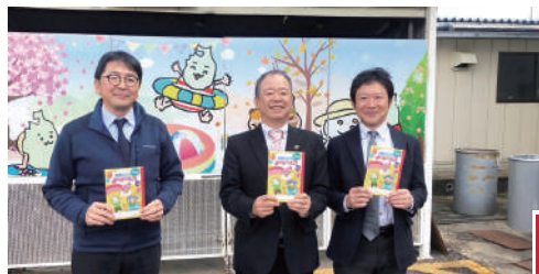
郡山市ウェブサイト