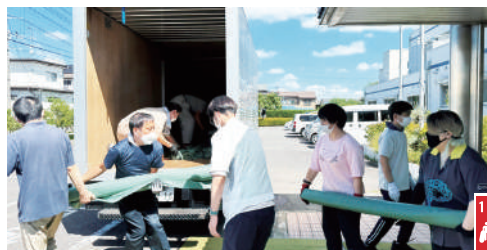
郡山市ウェブサイト