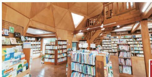
公式ウェブサイト