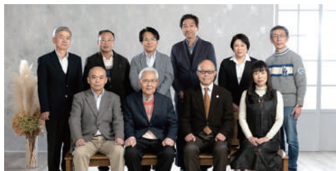
郡山市ウェブサイト