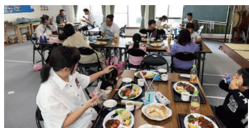
公式ウェブサイト