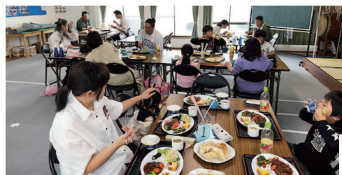
公式ウェブサイト