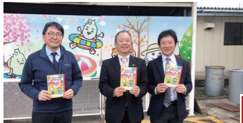
郡山市ウェブサイト