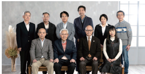
郡山市ウェブサイト