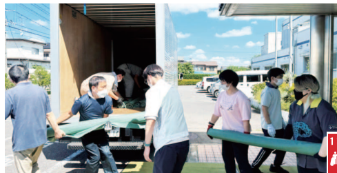
郡山市ウェブサイト