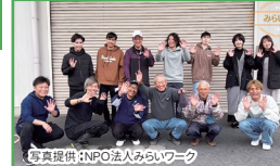
東京の若者を呼び込む 東京から若者を集め山菜採りを企画し福島の今を体験してもらいました！