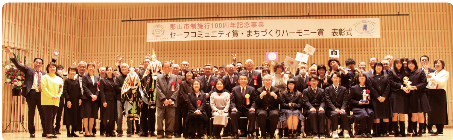
郡山市制施行100周年記念事業 セーフコミュニティ賞・まちづくりハーモニー賞 表彰式