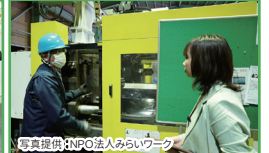
福島県の企業の見える化 企業様へ取材チームを派遣、動画を編集し SNS に掲載します