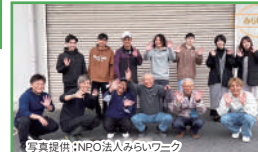
東京の若者を呼び込む 東京から若者を集め山菜採りを企画し福島を体験してもらいました！