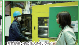
福島県の企業の見える化 企業へ取材チームを派遣、動画を編集し SNS に掲載します