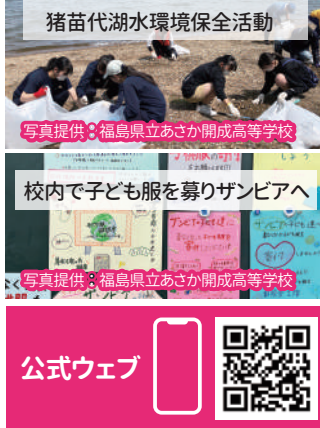
猪苗代湖環境保全活動 写真提供: 福島県立あさか開成高等学校 校内で子ども服を募りザンビアへ 写真提供: 福島県立あさか開成高等学校 公式ウェブ