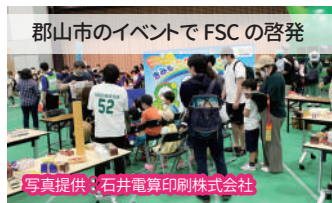
郡山市のイベントでFSCの啓発

石井さん 2022年に「SDGs未来都市セミナー」と題し郡山支部の主催でSDGsの勉強会を開催しました。違法伐採による森林破壊は、生物多様性を破壊し、人権侵害、感染症の拡大の一因となります。気候変動による地球温暖化や森林火災は、地球環境に大きなダメージを与えます。 紙をたくさん使用する私たち業界団体は、SDGsの活動に取り組みことで森林資源の持続可能な循環を推進します。地域の皆さんと一緒にSDGs活動を進めるためにも、イベントなどでのFSC認証マークの啓発にも力を入れて参ります。