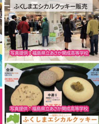
ふくしまエシカルクッキー販売 ふくしまエシカルクッキー