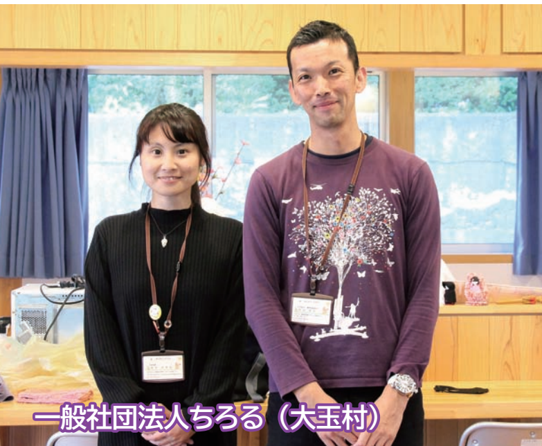
一般社団法人ちろる (大玉村)