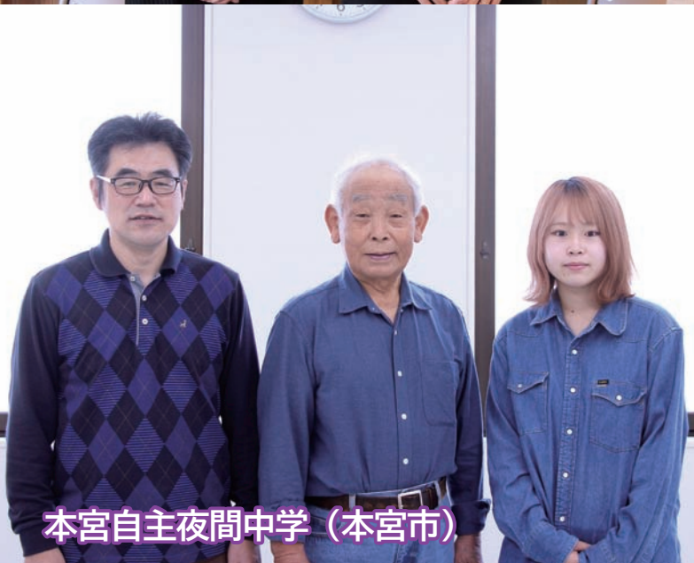
本宮自主夜間中学 (本宮市)