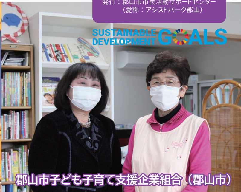
郡山市子ども子育て支援企業組合 (郡山市)