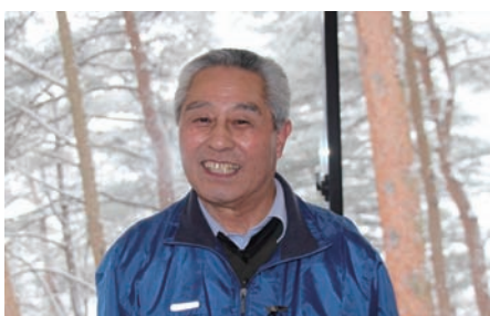
藤沼湖自然公園復興プロジェクト委員会