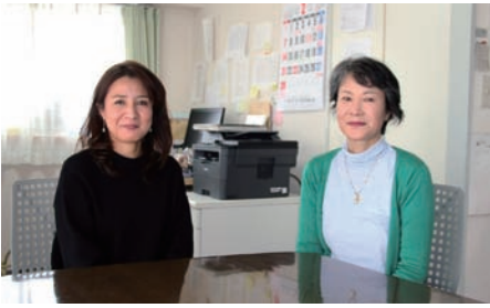
NPO 法人ウィメンズスペースふくしま