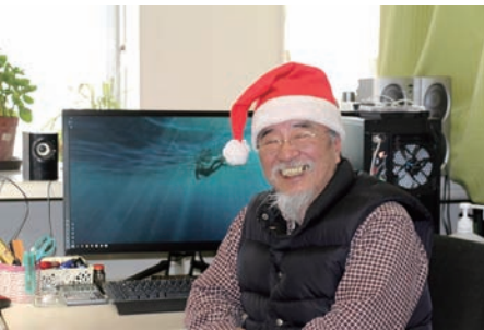
NPO 法人 FUKUSHIMA いのちの水