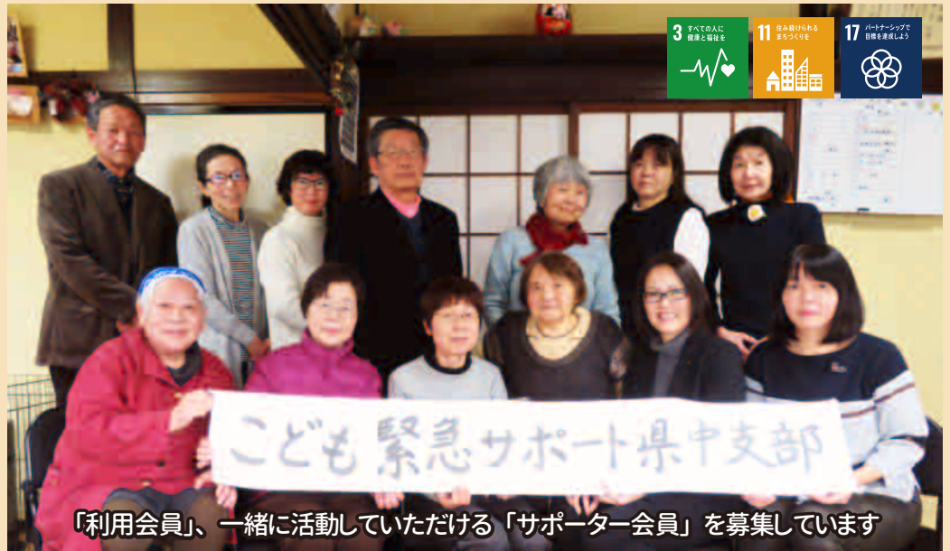
「利用会員」、一緒に活動していただける「サポーター会員」を募集しています

地域には、私達の支援が必要な人たちがもつているのではないかと感じ、利用会員、サポート会員を更に募集するために広報に力を入れ、市民に信頼される組織体制づくりを目指し法人化をしました。