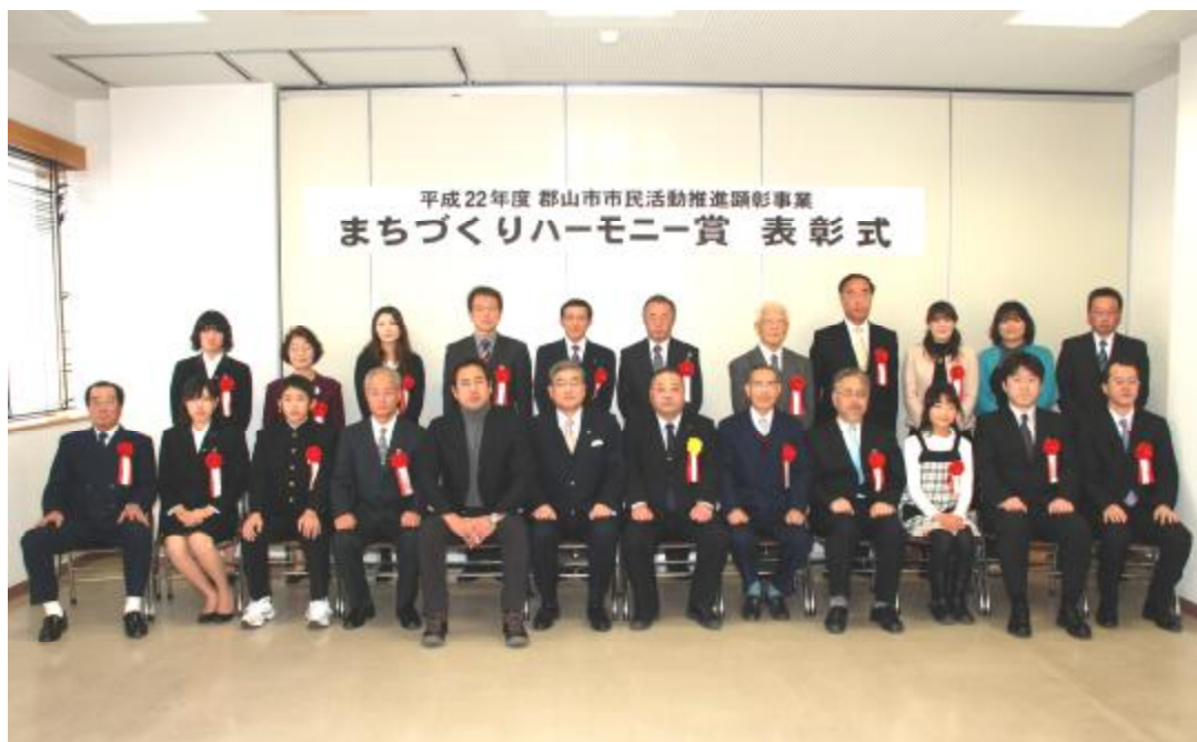
まちづくりハーモニー賞受賞者の皆さん