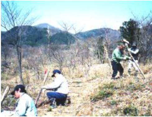
赤松林にて森林再生事業を行う 様子です。

下守屋地区の北側にある赤松林 (4ha)の森林再生事業を、3ゾ ーンに分けて行っています。