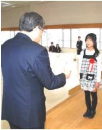
原市長から受賞者一人ひとりに賞状とトロフィーが贈呈されました。