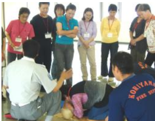
救急法（心肺蘇生法、AED 使用法） 受講の様子