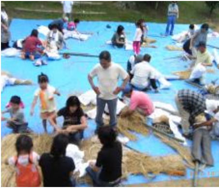
柴宮神社境内にて、案山子 講習会を行う様子です。