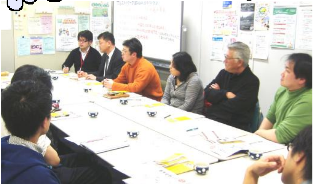
【第1回市民活動交流サロンの様子】

4月23日（金）に開催した「交流サロン」では、今年度のアシストパーク郡山の事業を説明するとともに、市民活動団体が今後活動の幅を広げるために、学生ボランティアの参加について活発な意見交換が行われました。