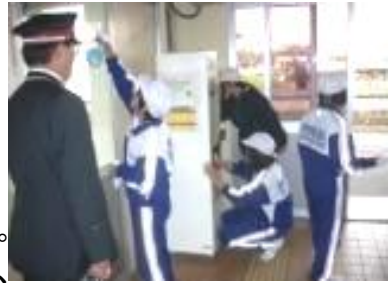
日和田駅舎清掃の様子

昨年は悪天候の中、生徒たちは計画に従い、懸命に活動へ取り組みました。「思ったより汚かった。一生懸命清掃をしたらきれいになったのでうれしかった」など、生徒たちの感想は前向き。