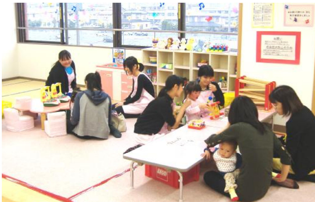
ニコニコ子ども館ボランティアの様子 ※今回特集しております。