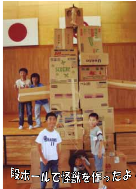
段ボールで怪獣を作ったよ！