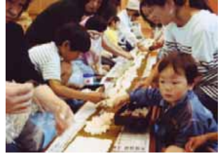
10メートル太巻きをつくったよ♪

あさかの子ども劇場 郡山に誕生してから24年になります。0歳からおとなの方まで、約300人の会員の方がいます。