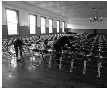
安積歴史博物館の清掃(ジョブトレーニング)