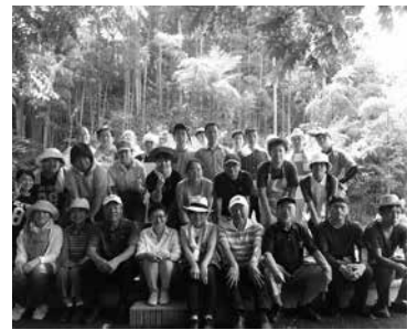
バーベキュー交流会