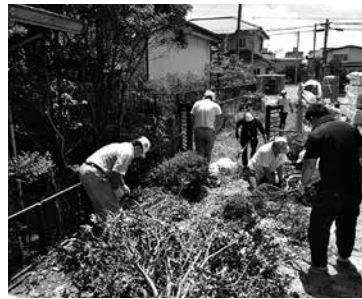
地域の困りごとのお手伝い事業